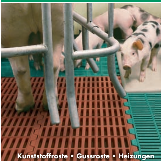
Kunststoffroste • Gussroste • Heizungen