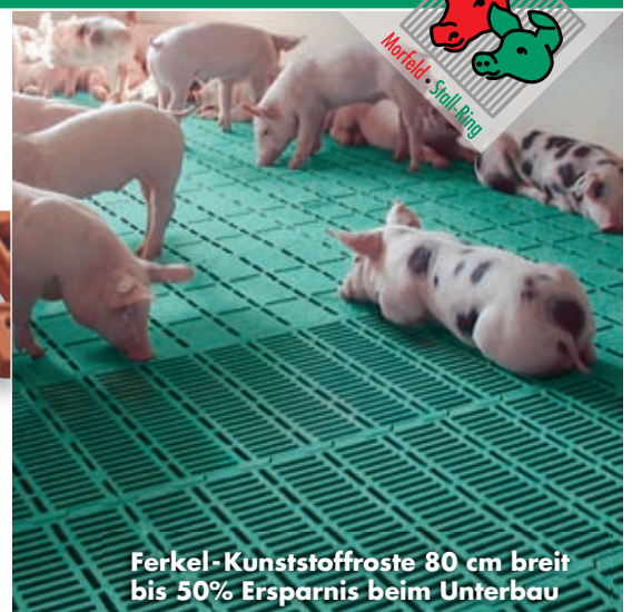
Ferkel-Kunststoffroste 80 cm breit bis 50% Ersparnis beim Unterbau