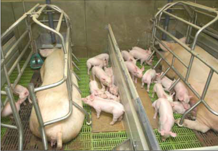
In der Abferkelbucht gilt es, den unterschiedlichen Ansprüchen von Sau und Ferkeln möglichst gut gerecht zu werden.